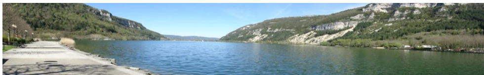
Lycée Xavier BICHAT NANTUA xavier-bichat.elycee.rhonealpes.fr ce.0010032e.ac-lyon.fr

Toutes les informations sur : http://eduscol.education.fr/bio/textes